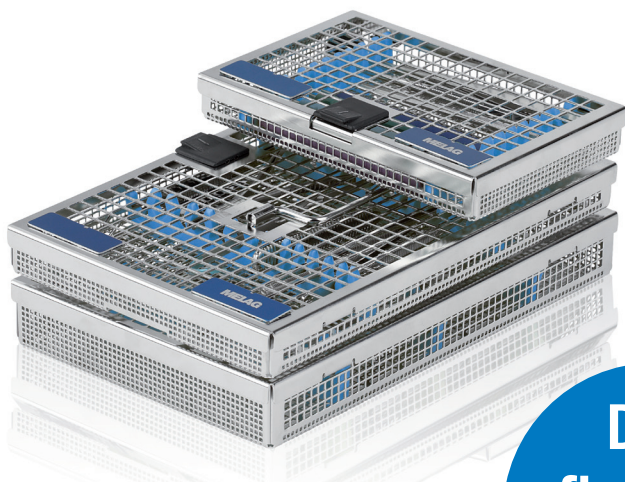
MELAstore – Trays

Durch die sichere Verwahrung der Instrumente im MELAstore-System wird der Schutz für das Praxisteam und für die Instrumente erhöht.