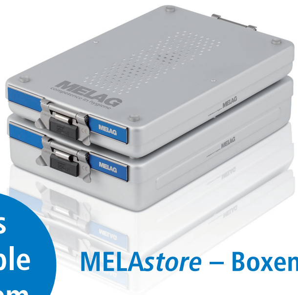
MELAstore – Boxen