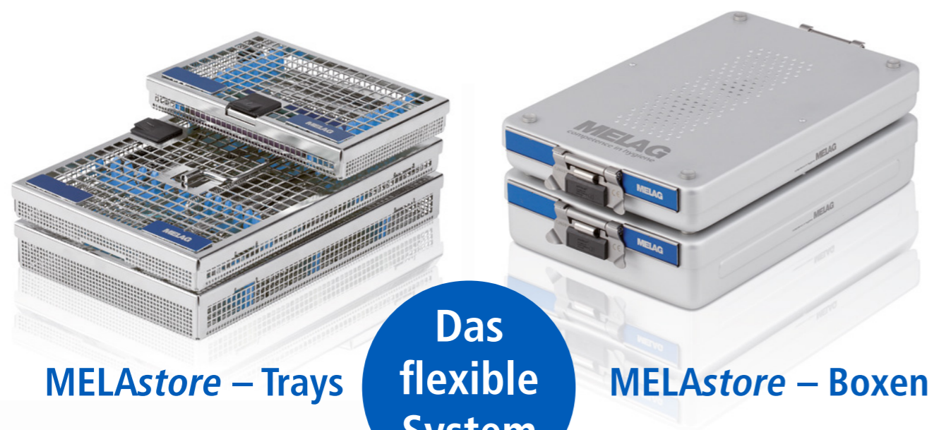
MELAstore – Trays

Durch die sichere Verwahrung der Instrumente im MELAstore-System wird der Schutz für das Praxisteam und für die Instrumente erhöht.